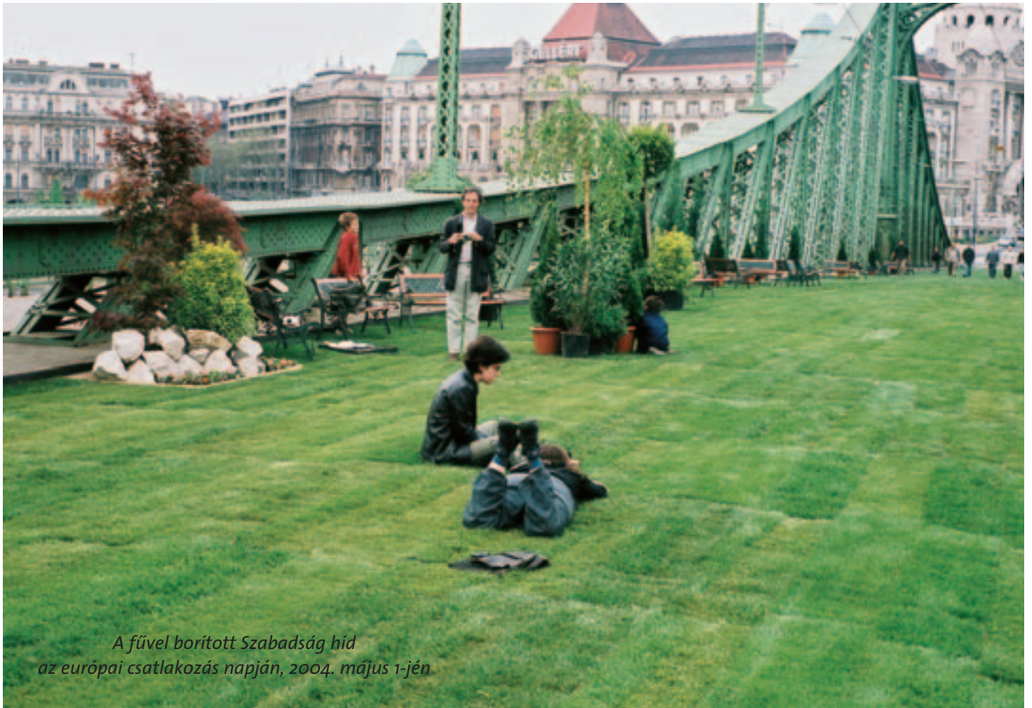
A fűvel borított Szabadság híd az európai csatlakozás napján, 2004. május 1-jén

A településrendezési szerződések az esetek többségében nem érintik a fővárost, mert az adott beruházás nem igényel Fővárosi Szabályozási Keretterv-módosítást. A fővárosnak külön erőfeszítéseket kell tennie annak érdekében, hogy nagyobb beruházások esetében a településrendezési szerződés meghatározásakor ne csak az adott kerület szempontjait vegyék figyelembe,