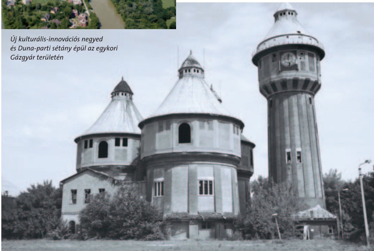
Új kulturális-innovációs negyed és Duna-parti sétány épül az egykori Gázgyár területén

A kormány szándékai szerint a megerősített régiókhoz feles törvényekkel elsősorban igazgatási, hatósági és tervezési jellegű központi feladatokat lehet delegálni. Budapestnek törekednie kell arra, hogy ezeken kívül a régió szereplői önkéntes elhatározás alapján megállapodjanak egyéb funkciók regionális szintre való delegálásában is. Szóba jöhetnek többek között a térségi tömegközlekedés, a hulladékgazdálkodás, a vízbázisvédelem, az egészségügy egyes elemei (kórházak, speciális szakrendelések), valamint a szakképzés.