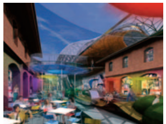
A Közraktárakban művészeti telepek, jól felszerelt stúdiók, kávéházak, közösségi és szolgáltatóházak létesülnek

Budapest az egyik legszínesebb európai főváros, egymást érik a legkülönbözőbb programok, fesztiválok. Lényeges, hogy a városnak a jövőben is legyen világos fesztiváldinamikája, az események szorosan kötődjenek Budapest kulturális tradícióihoz, jelenítsék meg kortárs művészeti értékeinket és illeszkedjenek a Budapest a kultúrák találkozáspontja gondolathoz. Legyenek új helyszínek, és a programok minél szélesebb körben váljanak hozzáférhetővé. Budapest 2010-ig olyan pályára álljon, melyben a kultúra és a kulturális turizmus húzó ágazatává tud lenni a gazdaságnak, és ezzel az elkövetkező évtizedek városfejlődésének irányát is kijelöli. A fapados járatok szerepének növekedésével nőtt az idegenforgalom, egyre növekszik az érdeklődés a „kulturális tradícióinknak”, illetve a „nemzetközi kulturális trendeknek” megfelelő programok iránt. Az autentikus folklór, a gasztronómia, a borkultúra, a tárgyi népi és iparművészet, a komolyzene és a dzsessz, a kortárs szoborkiállítások a köztereken mind-mind komoly érdeklődésre számot tartó