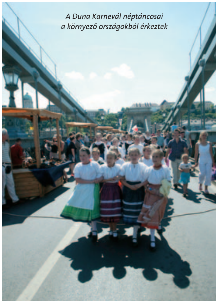
A Duna Karnevál néptáncosai a környező országokból érkeztek

Budapest kétszintű önkormányzati rendszere, amely sok vonatkozásban nagyon ellentmondásosan működik, csak 2/3-os törvények elfogadása esetén változtatható meg gyökeresen. Miután ezt a jobboldal többször megakadályozta, nem marad más megoldás, mint a mai rendszer keretein belül javítani a két szint együttműködését. (Emellett a Budapest-szerződés alapján meg kell alakítani azt a szakértőkből álló munkacsoportot , amely a miniszterelnök és a főpolgármester vezetésével kidolgozza a részletes tervet Budapest közigazgatás reformjára , és a társadalmi vitát követően véglegesíti azt. Így legalább két évvel a 2010-es önkormányzati választások előtt a szükséges törvénymódosításokat az Országgyűlés elé lehetne terjeszteni.)